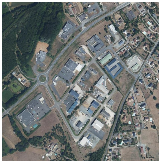
Figure 1 : Vue Aérienne "large" de la zone

La zone d'Aménagement Concerté (Z.A.C) de l'épine se situe en entrée de Ville de Savigné-l'Évêque le long de la Route Départementale 301. Elle est accessible depuis un Rond Point réalisé spécialement pour faciliter l'accès à la zone en 2004.